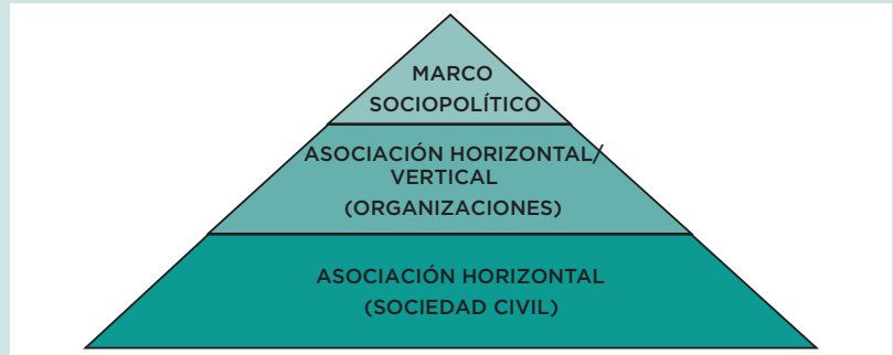
Figura 1. Niveles de Asociación del Capital Social